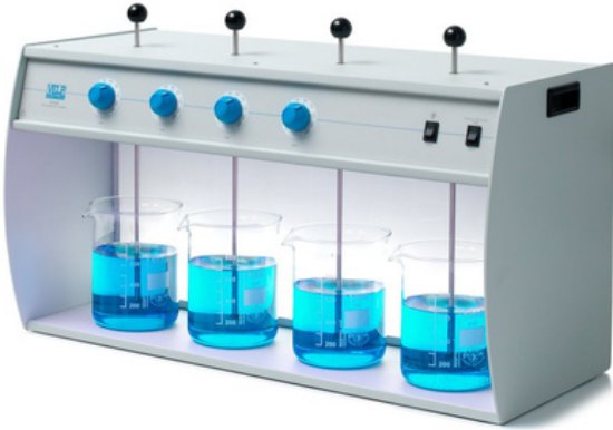
Flokülatörler / Jar Test Cihazları