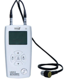
Ultrasonik Kalınlık Ölçer