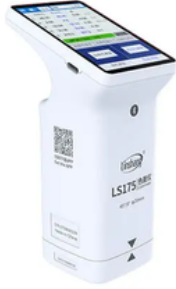
Kolorimetre Renk Ölçer