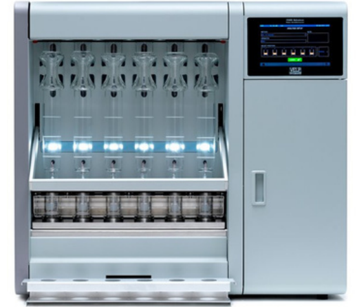
Selüloz Tayin Cihazları