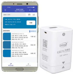
Portatif Renk Ölçer