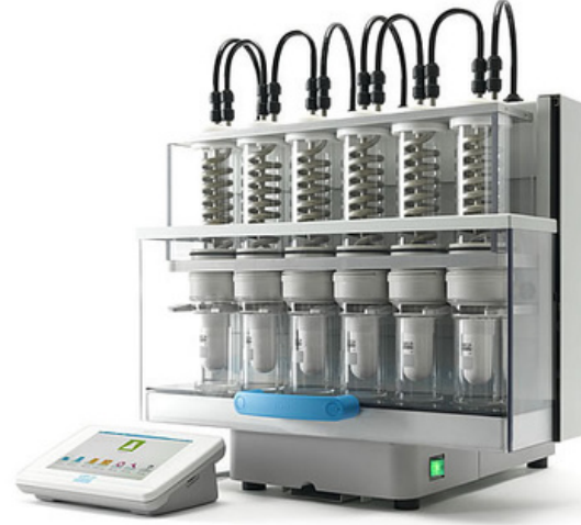
Yağ Tayin Cihazları