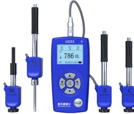
Leeb Sertlik Ölçüm Cihazı