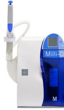
Saf Su Sistemleri