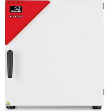
Etüvler / İnkibatörler