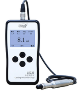
Kaplama Kalınlığı Ölçer